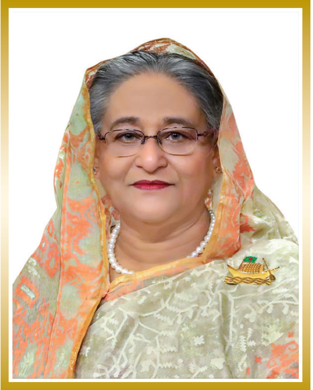
গণপ্রজাতন্ত্রী বাংলাদেশ সরকারের মাননীয় প্রধানমন্ত্রী শেখ হাসিনা