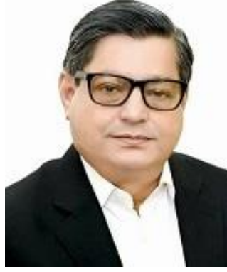
র,আ,ম, উবায়দুল মোকতাদির চৌধুরী, এম,পি মাননীয় মন্ত্রী, গৃহায়ন ও গণপূর্ত মন্ত্রণালয় ও সভাপতি, পরিচালনা পরিষদ হাউজিং এন্ড বিল্ডিং রিসার্চ ইনস্টিটিউট।